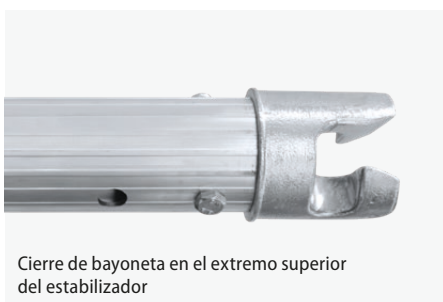
Cierre de bayoneta en el extremo superior del estabilizador