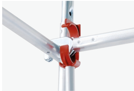
Desmontaje de tubos de barandilla rectos