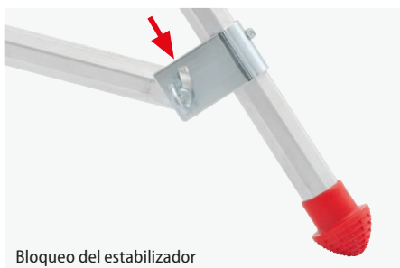
Bloqueo del estabilizador