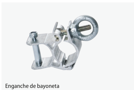
Enganche de bayoneta