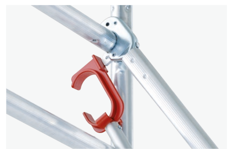
Desmontaje de tornapuntas diagonales de barandilla

El elevador HYMER-Lifter facilita el montaje y desmontaje seguro y rápido de los tubos de refuerzo y las diagonales desde cualquier posición.