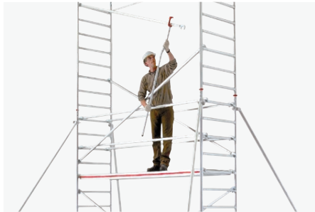
Elevador HYMER-Lifter en el montaje